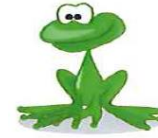
A frog : une grenouille